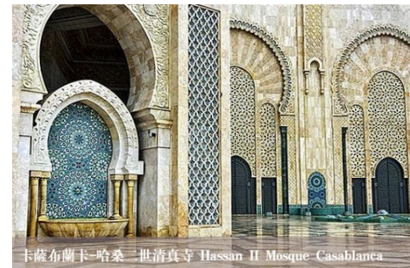
卡薩布蘭卡-哈桑二世清真寺 Hassan II Mosque Casablanca

卡薩布蘭卡(Casablanca) 是摩洛哥商業中心，一部『北非諜影』不僅鑄就了電影史上不朽的地位，也讓全世界記住了這座有著如此浪漫名字的城市。前往地標，被稱為“海上清真寺”的 哈桑二世清真寺(Hassan II Mosque) ，於1993年完工，部分建築屹立在水面上，有210m尖塔，上面的激光指向麥加；然後漫步於 濱海大道(Corniche) ，陣陣大西洋海風以及林立的酒店展現著優雅的都市魅力；繼續沿著居民區驅車一小段時間到達市中心，參觀 穆罕默德五世廣場(Mohamed V Square) ， 哈布斯(Habous)街區 和 巴黎聖母院盧爾德教堂(Notre Dame de Lourdes Cathedral) 。